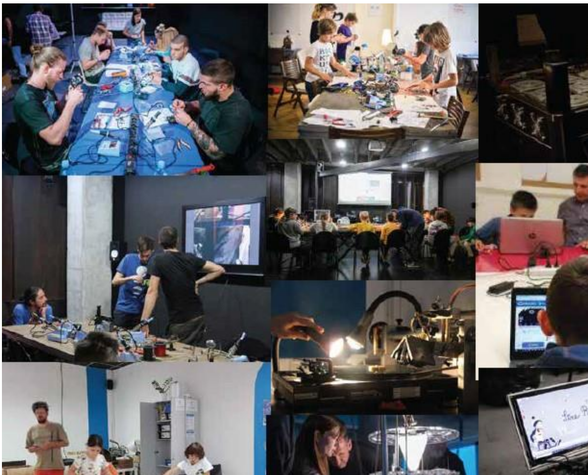
Fotografija 1: Tako »živ« in obiskan delavničarski STUDIO si želimo

V primeru povezovanja projekta konS, ki je v celoti financiran s sredstvi Evropskega sklada za regionalni razvoj, in predloga participativnega proračuna v prostoru STUDIA je projekt konS zavezan k dokazovanju rezultatov projekta še določeno obdobje po končanju projekta (npr., če v delavničarskem STUDIU vzpostavimo konS – lab mora MKC Maribor dokazovati rezultat vzpostavljenega laba še določeno število let po zaključenem projektu).